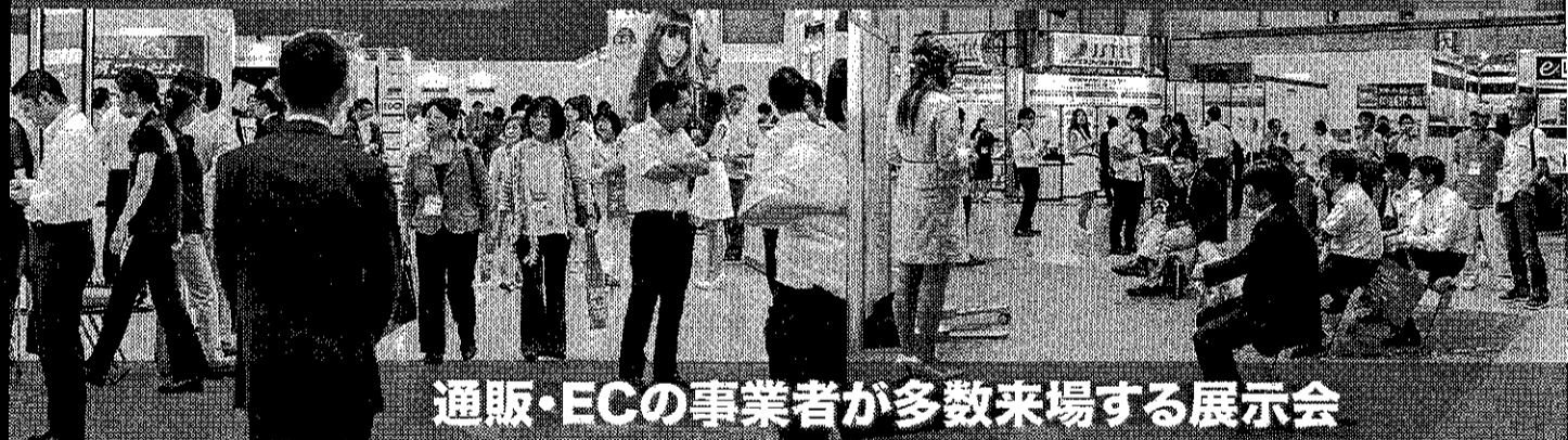
通販・ECの事業者が多数来場する展示会